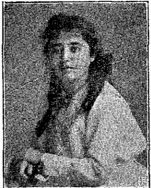
ΦΟΥΛΑ ἐν Καλάμας, βραβευθεὶσα εἰς τοὺς Διαγωνισμοὺς 1480ν...